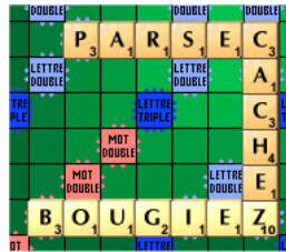
Figure 2: En plaçant "BOUGIEZ" le joueur complète aussi "CACHEZ" et marque donc les points de ces 2 mots.