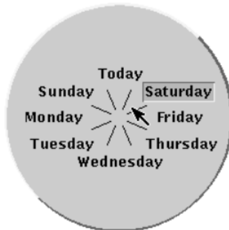
Figure 1: Implémentation originale du premier menu circulaire

Les menus circulaires ( pie menus ) ont été proposés en 1991 par Don Hopkins.